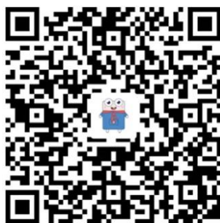
万方数据 app 二维码

使用“万方数据”APP 免费看论文，需要与机构账户绑定，绑定成功后个人账户可在 APP 中享有机构权限，如免费下载机构已购资源、免费使用机构已开通服务等。